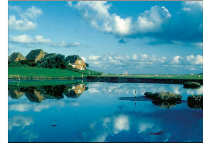
Hooge: auf der Warft stehen die Häuser im Trockenen

Die 10 bis 956 Hektar großen Halligen sind Reste des Festlandes und von Inseln, die nach den großen Sturmfluten übrig geblieben sind. Auf den 10 Halligen wohnen insgesamt nur circa 400 Menschen. Sie leben hauptsächlich von Tourismus und Küstenschutz, sowie Viehzucht auf den fruchtbaren Salzwiesen.