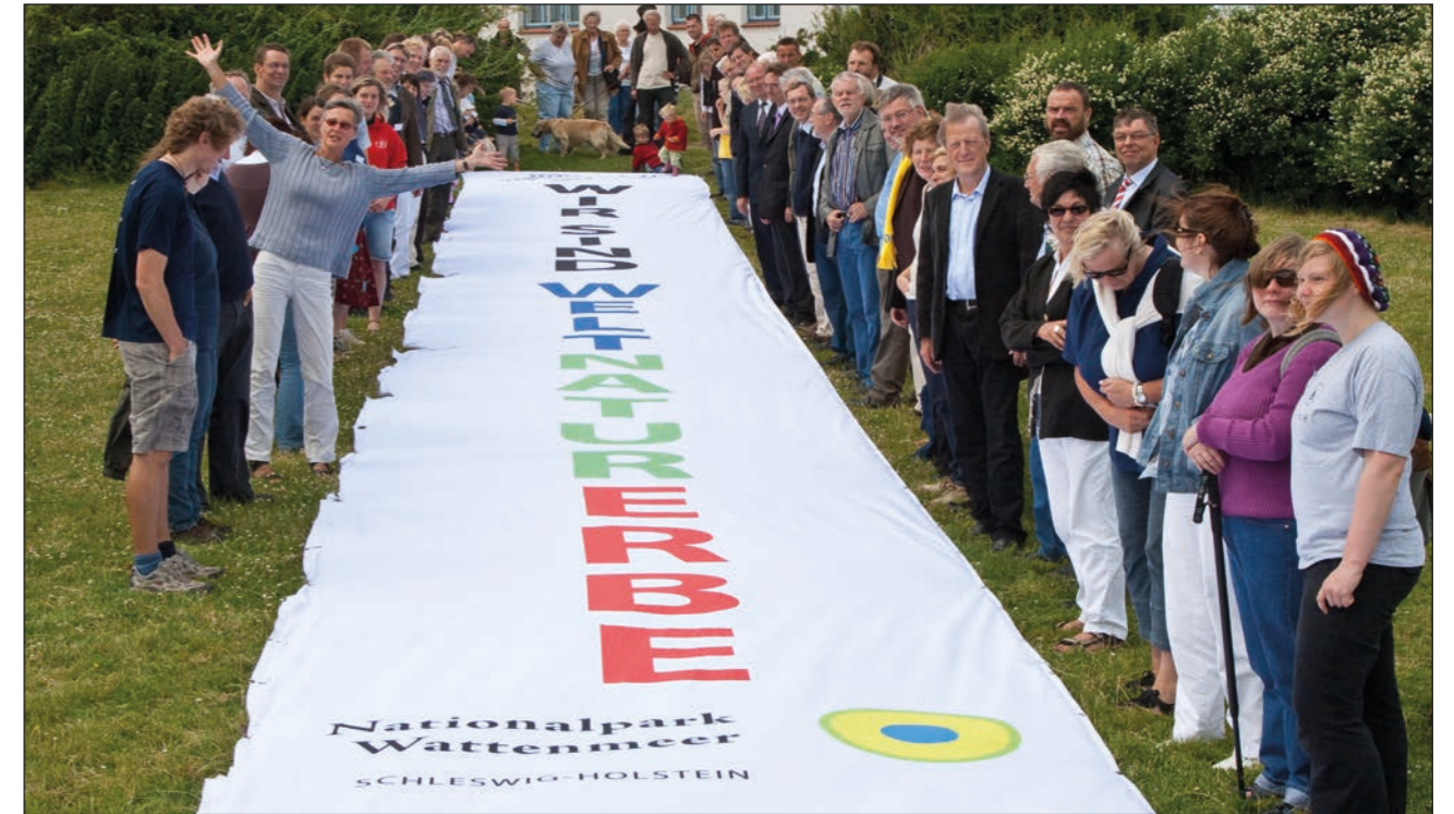
„Wir sind Weltnaturerbe“: Im Juni 2009 wurde im Nationalpark Wattenmeer gefeiert.