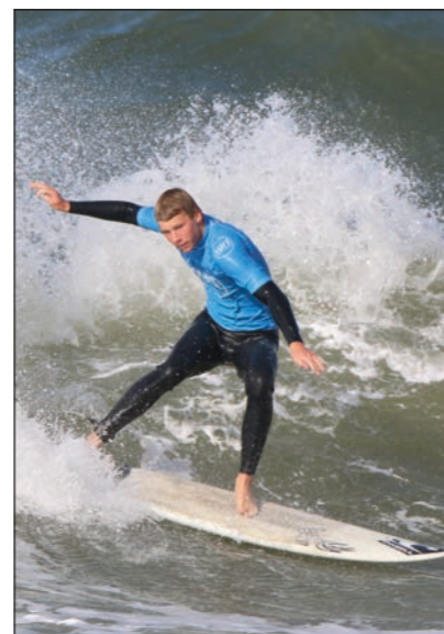
Wellenreiter vor Sylt