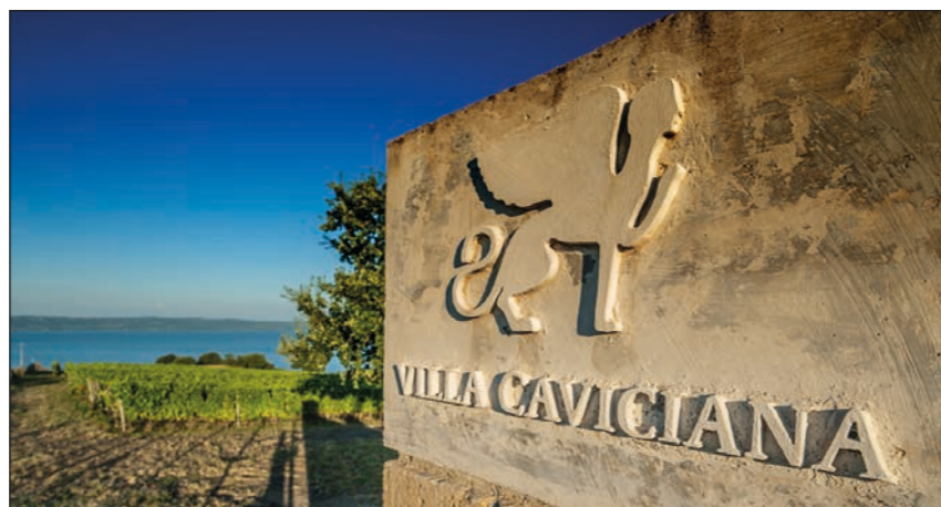
Blick über die Weingärten zum Lago die Bolsena

und geologischen Gegebenheiten. Die vulkanischen Böden bieten ideale Bedingungen für den Wein- oder Olivenanbau. Die Lage am See sorgt für ein spezielles Mikroklima mit hei-