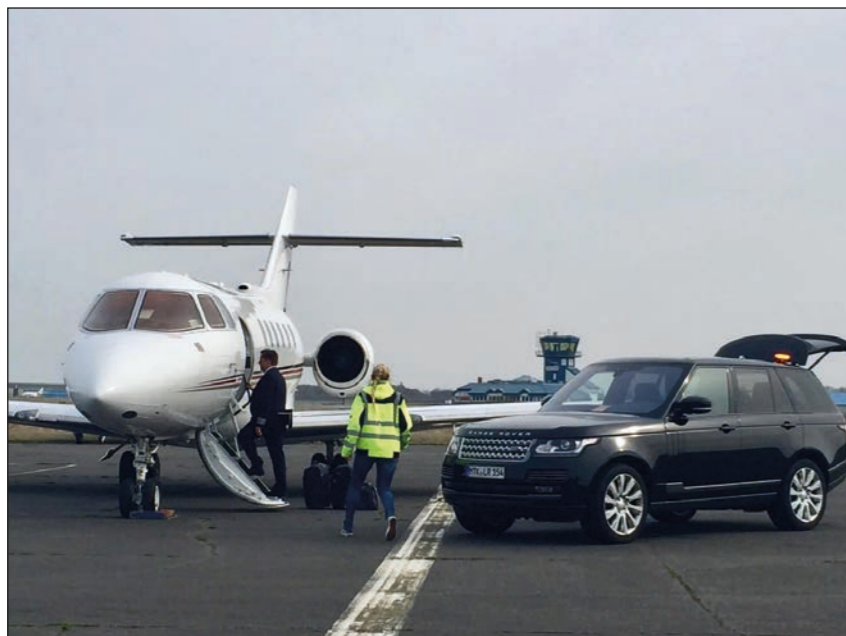
Unterstützung beim Beladen

Die Handling Kunden, mit größtenteils kleineren und mittleren Jets, fliegen meist aus dem deutschen Raum und den umliegenden Nachbarländern nach Sylt. Manchmal fliegen größere Privatflieger aber auch direkt aus den USA oder anderen entfernteren Ländern nach Sylt. Ohne das Handling Team würde eine Abfertigung in vielen Fällen gar nicht funktionieren.