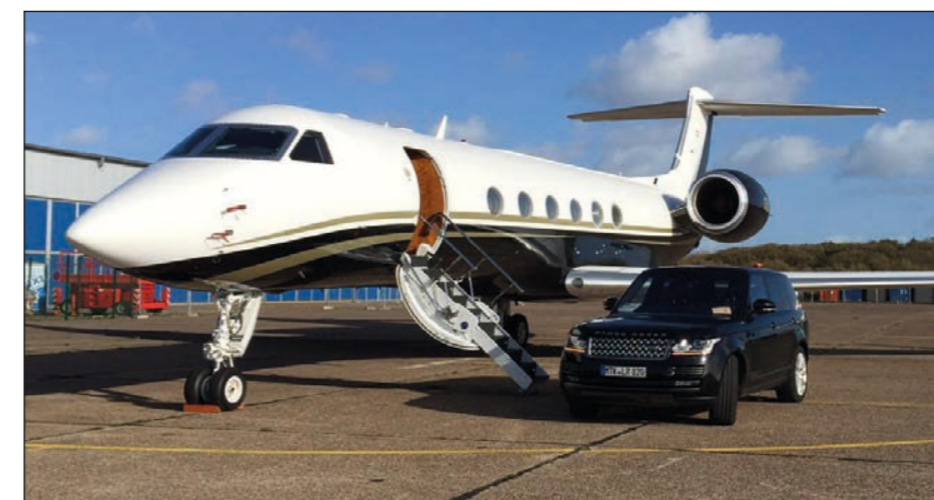
Handling auf Vorfeld III / Flughafen Sylt

Bewegungseinschränkungen werden unterstützt, mitreisende Tiere werden versorgt, Mietfahrzeuge werden direkt an den Flieger gestellt und vieles mehr.