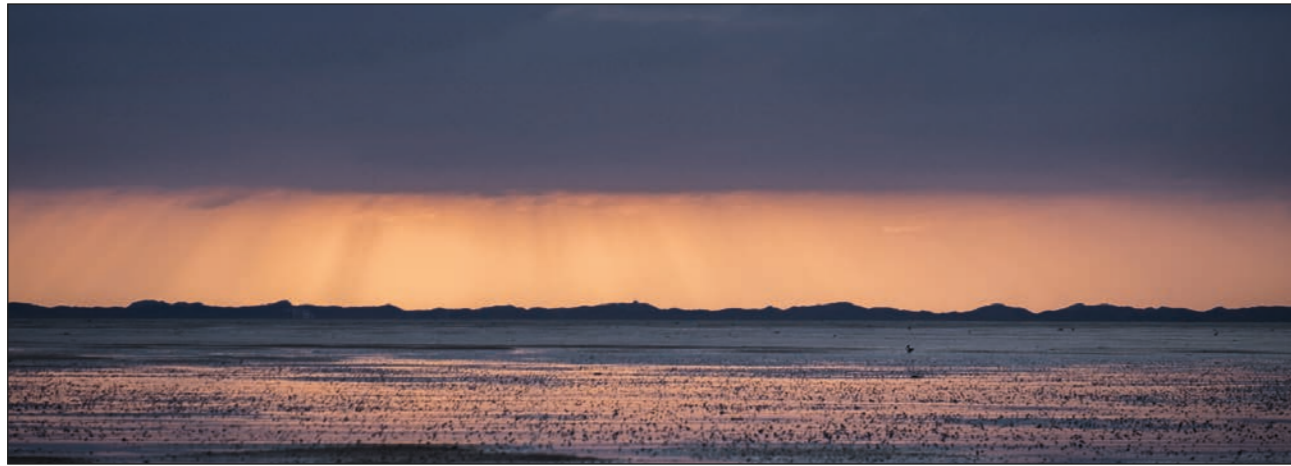
Abendhimmel im Watt vor Sylt: Das Weltnaturerbe Wattenmeer ist ein Ökosystem der Extraklasse.

lich neu. Mehr als 10.000 Tier- und Pflanzenarten sind hier heimisch, mehr als zehn Millionen Zugvögel nutzen das Wattenmeer jedes Jahr als Rastplatz und Energietankstelle. Damit erfüllt dieses die strengen UNESCO-Kriterien für ein Weltnaturerbe. Danach muss dem entsprechenden Lebensraum, um es in kurzen Worten zu sagen, unter anderem hinsichtlich der geologischen und der ökologischen Prozesse ein international herausragender Wert zukommen sowie große Bedeutung für den Erhalt der bio-