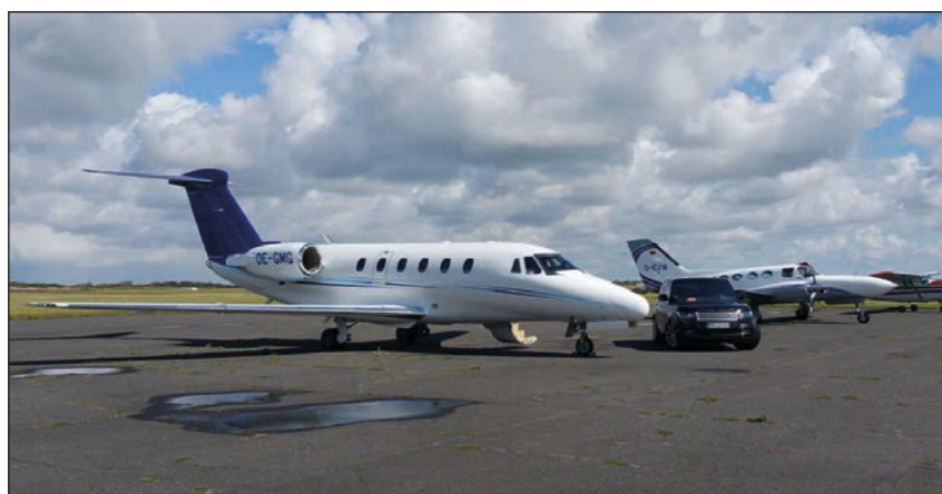
gleichzeitig mehrere Handlings

Jeder Kunde, Pilot und Passagier ist hier gern gesehen und die Begrüßung fällt stets herzlich aus, so als würde man ein Familienmitglied wiedersehen. Eben „Ein herzliches Willkommen auf Sylt!“