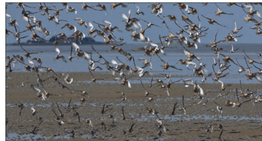
Mehr als zehn Millionen Zugvögel nutzen das Wattenmeer jedes Jahr als Rastplatz und Energietankstelle.

sondern entlang der gesamten Wattenmeerküste: Die UNESCO, die Organisation für Bildung, Wissenschaft und Kultur der Vereinten Nationen, hatte das Wattenmeer der Niederlande, Niedersachsens und Schleswig-Holsteins gerade zum Weltnaturerbe erklärt. Der Wattenmeeranteil Hamburgs kam zwei Jahre später hinzu, der Dänemarks wenige Tage vor den Feiern zum fünften Geburtstag.