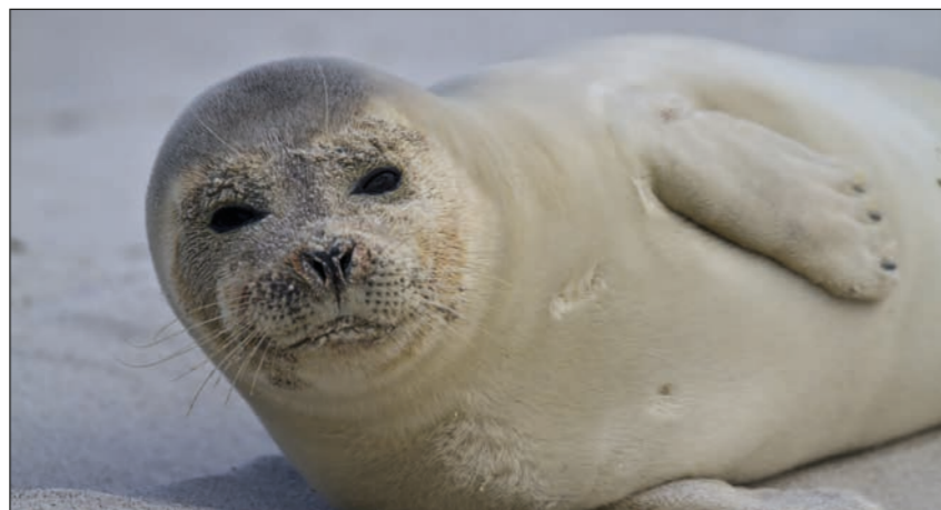
Seehunde gehören zu den wohl bekanntesten Bewohnern des Weltnaturerbes Wattenmeer.

Jubelruf ertönte am 26. Juni 2009 nicht nur in der im nordfriesischen Tönning ansässigen Nationalparkverwaltung,