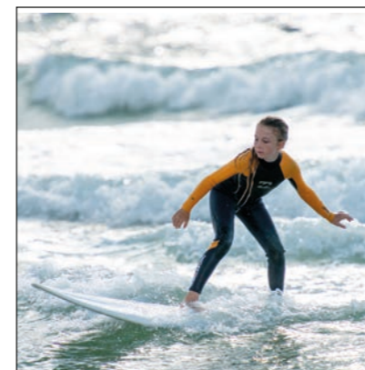
Kids Day - die erste Welle