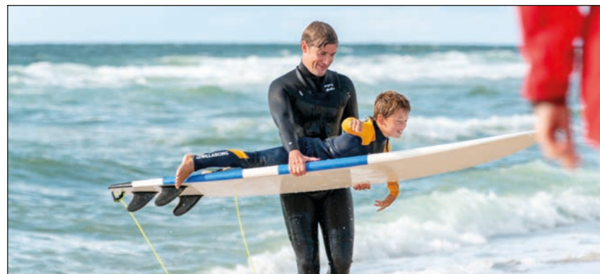
Kids Day - die Jüngsten

Im Sommers 1964 machten sich die beiden Rettungsschwimmer Uwe Behrens und Klaus Tangle auf den Weg nach Biarritz, um die ersten von Michelle Barland geschapten Surfbretter nach Sylt zu holen. Die neuen Surfboards waren leichter, kürzer und hatten eine Finne. Per Brief orderte