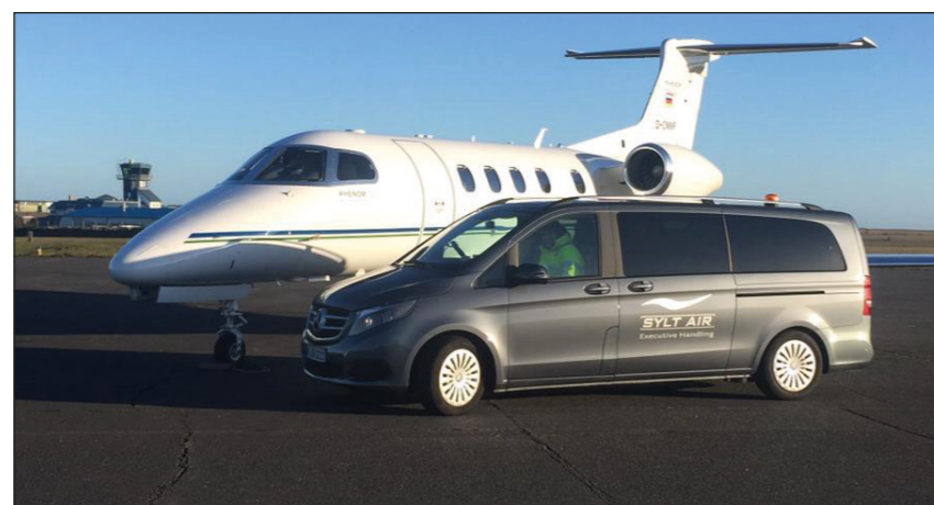
Handling auf Vorfeld II/Flughafen Sylt

von den Passagieren wird das Gepäck gleich bei Ankunft übernommen und im Flieger verstaut, Catering bestellt, abgeholt und an Bord gebracht, Personen mit