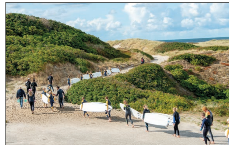
Surfer mit Surfboards auf dem Weg zum Strand

Sie möchten die Jugendarbeit und den Verein unterstützen? Weitere Informationen zum Surf Club Sylt gibt es auf www.surfclubsylt.de .