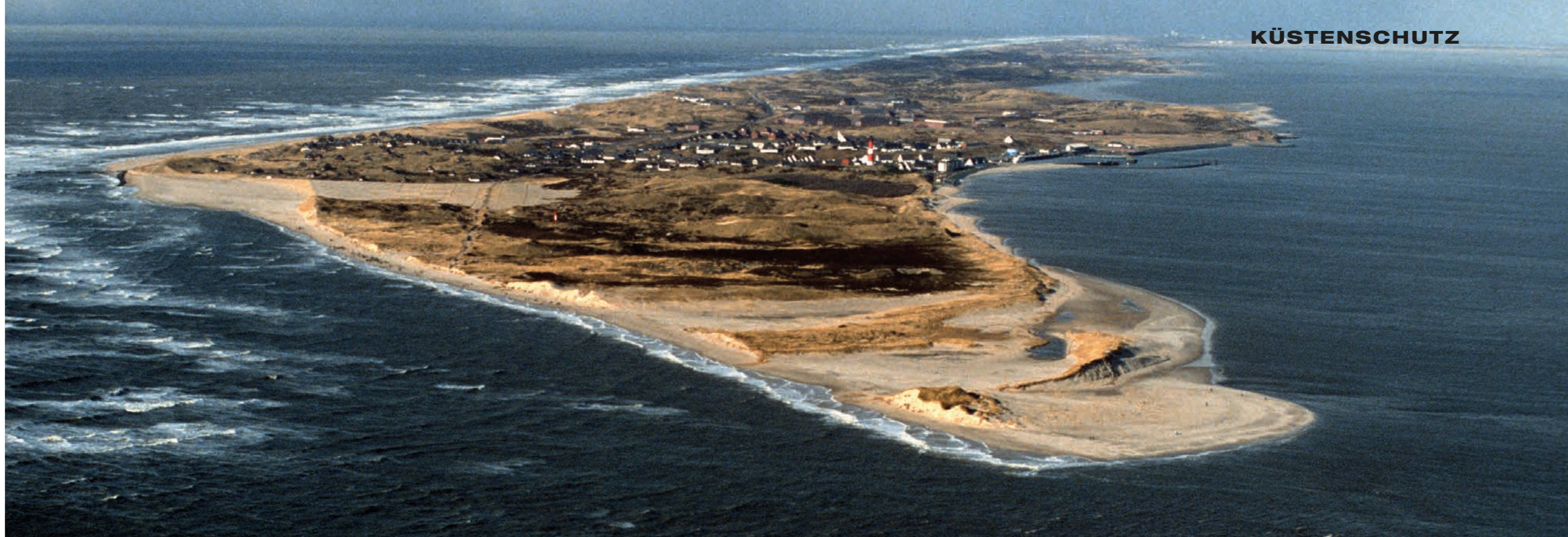
Luftaufnahme Sylt - Odde von 1987