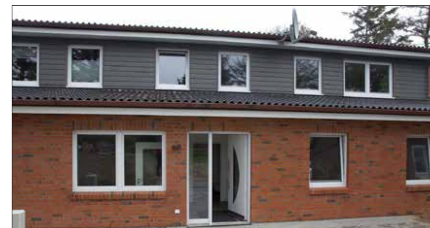
Der Neubau des Sylter Tierheims wurde im Sommer 2019 fertiggestellt