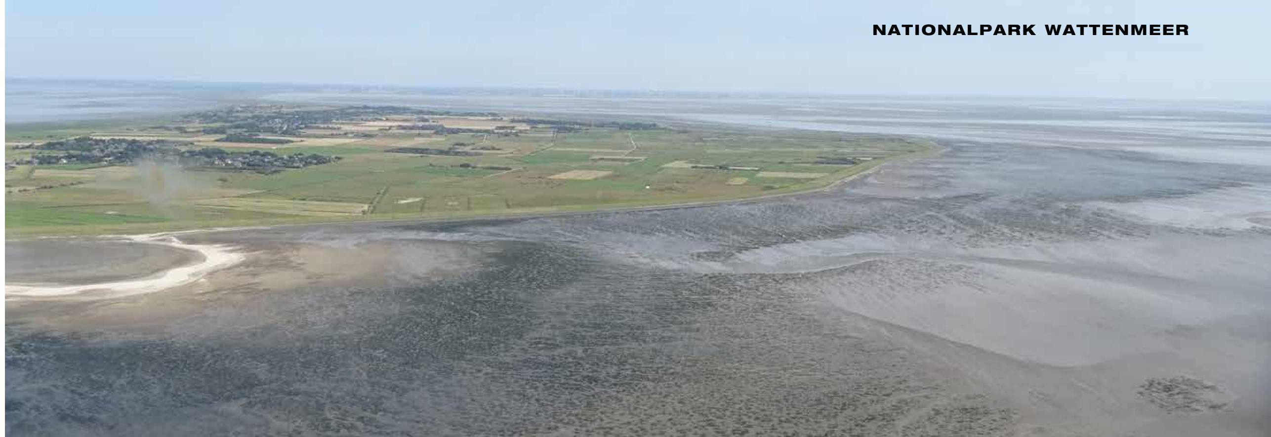
Eine Seegrasswiese vor Sylt bei Archsum: Der Wattboden ist (mehr oder weniger dicht) dunkelgrün gepunktet und von kleinen Prielen durchzogen.