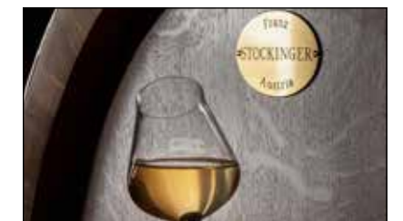
Mit einem Hauch von Reifennoten

Da Collery sich nicht nur auf Röstaromen verlassen wollte, suchte man auch nach Komplementär-Aromen. Und fand sie in den Grand Cru Weinen aus Bouzy, einer Fläche in der Champagne, welche für ihre opulenten und würzigen Pinot Noirs bekannt ist. Die Rechnung ging auf und der Champagner Empyreumatic 2014 Grand Cru ist wahrlich gelungen. Neben leicht rotbeerigen Noten zeigt er auch Nuancen von Orangenschalen und Williams Christ-Birne. Mit über fünf Jahren Hefelager hat man ihm zusätzlich noch eine schöne Cremigkeit verliehen mit einem Hauch von Reifennoten. Et voilà, entstanden ist ein Champagner, der tatsächlich zur Zigarre passt.