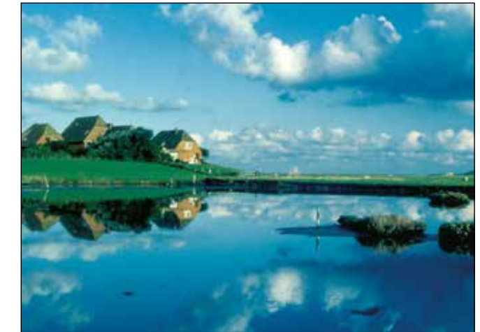
Hooge: auf der Warft stehen die Häuser im Trockenen

Die Halligen sind kleine Inseln, die mehrmals im Jahr überflutet werden. Die Häuser stehen dicht beieinander auf künstlich aufgeschütteten, meterhohen Hügeln, den sogenannten Warften, so bleiben die Häuser in der Regel trocken. Bei extremen Sturmfluten, wenn auch die Warften überspült werden, bringen sich die Bewohner auf dem Dachboden in Sicherheit.