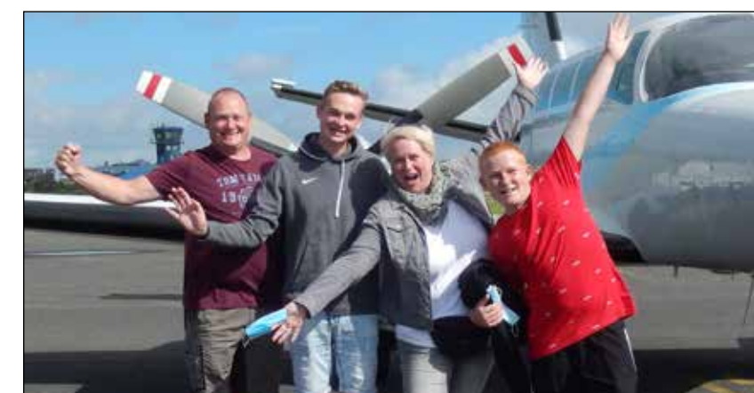
Glücklich und begeistert nach einem Rundflug

Seit mehreren Jahren trägt die Sylt Air mit kostenfreien Rundflügen für die kranken Kinder zu deren Genesung bei. Von April bis Oktober dürfen zehn Kinder pro Monat in einem ausgedehnten Rundflug die Insel abfliegen. Am Flugtag stürmen die zehn ausgelassenen kleinen Passagiere mit Eltern und Geschwistern die Passagier-Lounge der Sylt Air. Jedes Mal ein großes Hallo und ein ausgesprochen hoher Höhepunkt für ALLE!!!