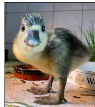
Die Ente "Bente"

Spenden können Sie einfach und schnell via Paypal konto@tierheim-sylt.de