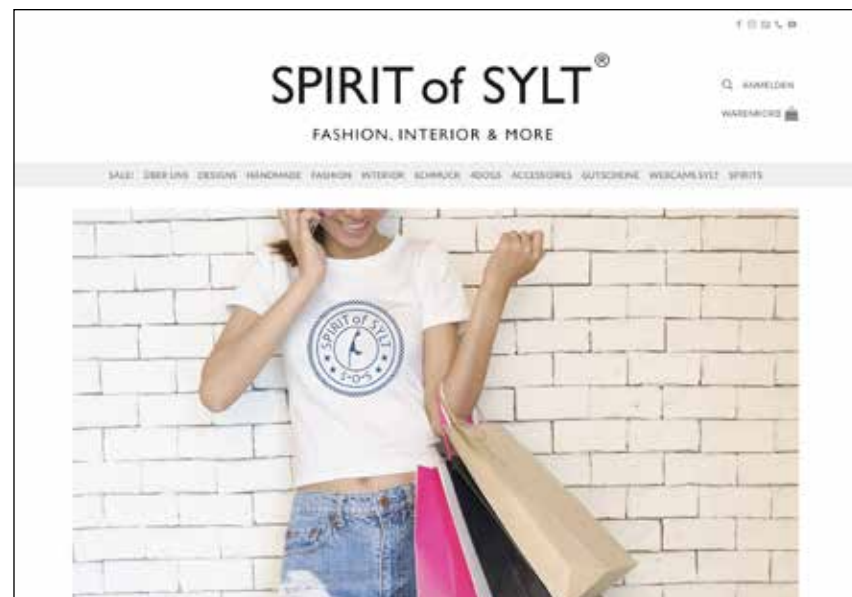
Neu ist nun auch der Life-Style-Shop von SPIRIT of SYLT: www.spirit-of-sylt.com/shop

Geblichen ist in den Jahren die Leidenschaft und die Liebe zum Detail, mit der neue Spirituosen kreiert und Produkte designt werden.