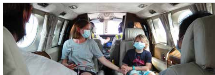
Kurz vor dem Start zum Inselrundflug

Von Juli bis zum Oktober 2020 flogen nun insgesamt 16 Familien über Deutschlands schönste Insel. - ein absolut einmaliges und unvergessliches Erlebnis! DANKE Sylt Air!!!