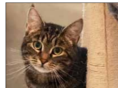
Eine von den 30 Tierheim-Katzen