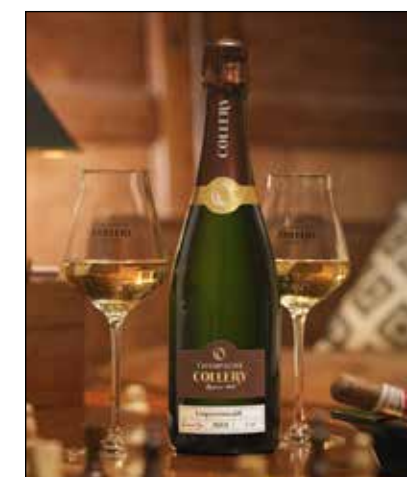
Immer höchste Qualität

Der Trick des Collery Champagners liegt in einer Cuvée aus Weinen, welche in Fässern verschiedener Küfer reifen. Darunter auch eines der weltberühmten österreichischen Fassbinderei Stockinger, einer