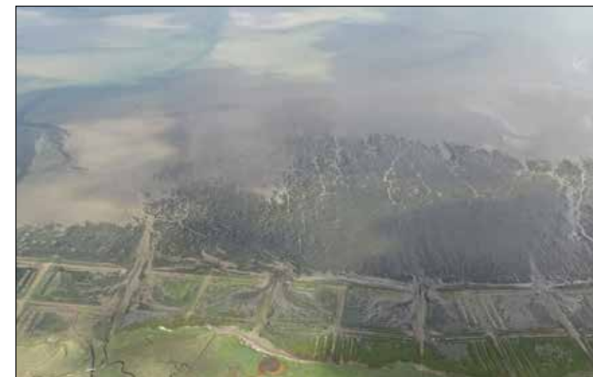
Dunkelgrüne Seegrasswiesen wachsen gerne ufernah dicht an der Festlandsküste oder den Inseln und Halligen.

1989 erstmals übers Wattenmeer und entdeckte die Grünalgen-Teppiche fast überall. Etwa 20 Prozent der gesamten Wattfläche waren von den Wasserpflanzen bedeckt. Eine andere Sorte von Grün vermisste er hingegen: Dunkelgrüne Wiesen von Seegrass. Eigentlich bewachsen sie weite Teile des Wattbodens, waren aber nun nur noch klein und spär-