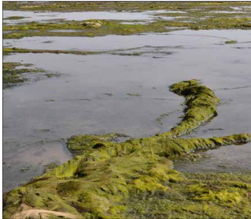
Grünalgen können sich zu dicke Matten und "Würsten" ausbilden, die dann Seegras unter sich begraben.

beschränkt sich der Raum auf das nördliche Wattenmeer. Das südliche und zentrale Wattenmeer liegen zu nah an den großen Flussmündungsgebieten wie Elbe, Weser und Ems, über die auch nach der Reduzierung noch zu hohe Mengen an Nährstoffen ins Watt transportiert werden. Dennoch ist seit Ende der 1990er Jahren zu beobachten, dass die Seegraswiesen im Norden des Wattenmeeres wieder genesen und an Fläche und Dichte zugenommen haben, während gleichzeitig die Grünalgenbestände zurück gingen. Allmählich hat eine Rückentwicklung von „algen-grün“ zu „seegras-grün“ stattgefunden.