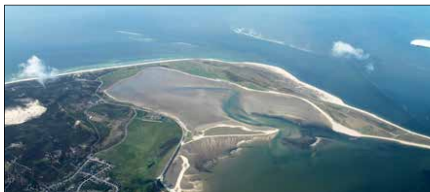
Blick aus ca 2000m auf den "Ellenbogen"

IBAN: DE61 2179 1805 0000 3663 66 BIC: GENODEF1SYL