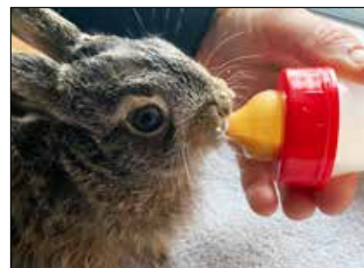
Flaschenaufzucht eines Feldhasen

Mehr über das Tierheim und die Möglichkeiten einer Unterstützung finden Sie online unter