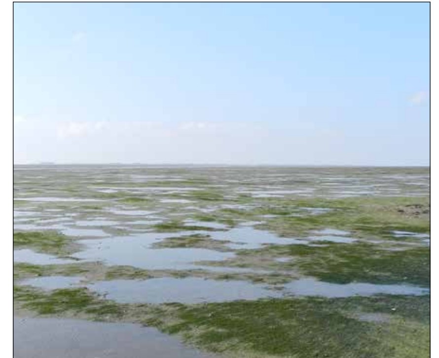
Die großflächige Seegraswiese ist auch bei Ebbe immer noch ein feuchter Ort mit Pfützen und Tümpeln.

Im Jahr 2020 gab es mit über 188 km 2 Seegrasfläche einen