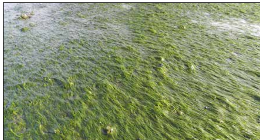
Zwischen den vielen einzelnen Grashalmen einer dichten Seegrasswiese finden viele Tiere ein Versteck und Zuhause.

massenhaft vermehrt hatten. Über das wirkliche Ausmaß war man sich zu der Zeit allerdings noch nicht im Klaren. Reise flog