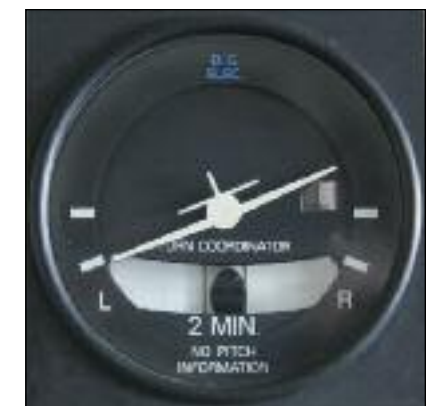
Ausführung mit Flugzeugsymbol, Standardkurve links

In einer sauber geflogenen Kurve bleibt die Kugel stets in der Mitte zwischen den beiden Strichen. Ist das der Fall, rutscht man auf seinem Sitz weder wegen der Schräglage nach innen (Schwerkraft), noch wird man wegen der Drehung nach außen geschleu-