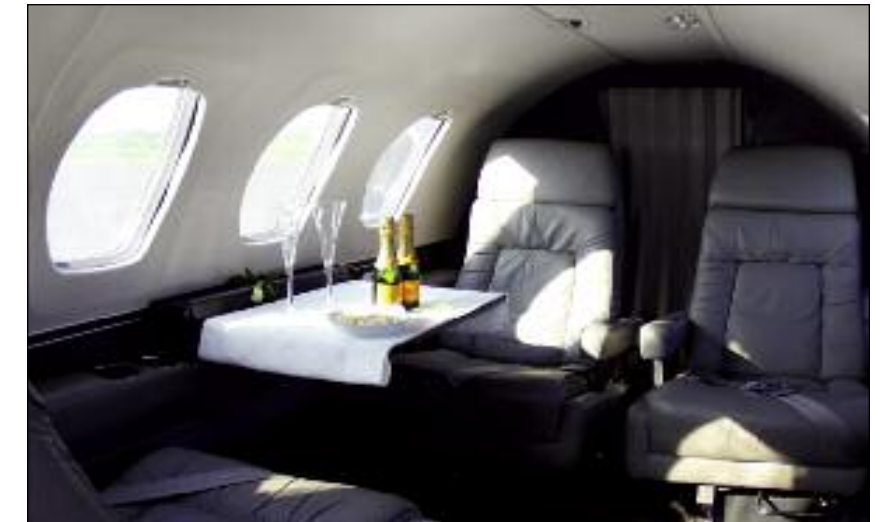
Luxus pur: so werden auch längere Strecken zum Genuss

Der Jet ist für Flughöhen bis 11.000m zertifiziert, das bedeutet