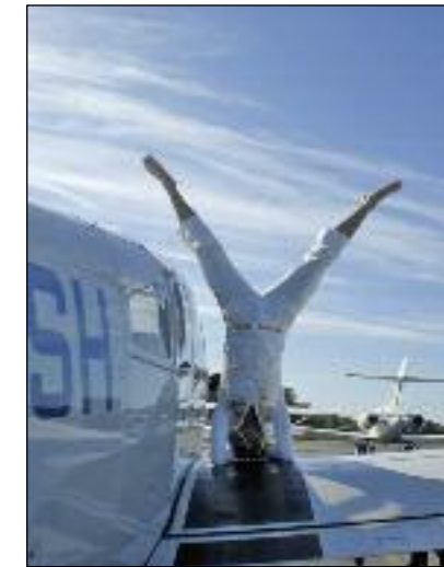
Yoga auf der Tragfläche

Normalerweise wird überzähliges Gepäck dann von der nächsten Maschine nach Sylt mitgenommen.