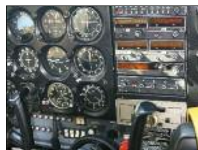
Cockpit eines Schulflugzeugs

Anders als bei großen Schulen mit vielen Flugschülern kümmern wir uns von Anfang an um jeden Ihrer