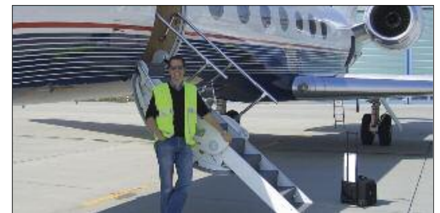
Training auf dem neuen Arbeitsgerät Gulfstream G550

Die Zeit kann einem da ganz schön lang werden. Zwar ist das Cockpit in einem Businessjet nicht so tabu wie auf Linienflügen, aber es ist doch eher selten, dass uns jemand hier vorn besucht, Kontakt zu den Passagieren entsteht kaum. Das war bei der SYLT AIR ganz anders, ich erinnere mich gern an viele schöne Gespräche mit Euren Gästen. Seid gegrüßt, ich wünsche „many happy landings“!