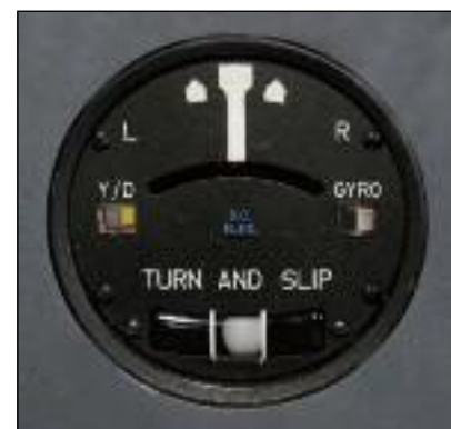
Ausführung mit Pinsel, Geradeausflug

Ausführungen, als „Pinsel“ und als Flugzeugsymbol.