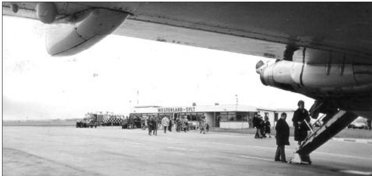
Zu Fuss über das Rollfeld

Wir danken dem SYLTER ARCHIV für die Unterstützung!