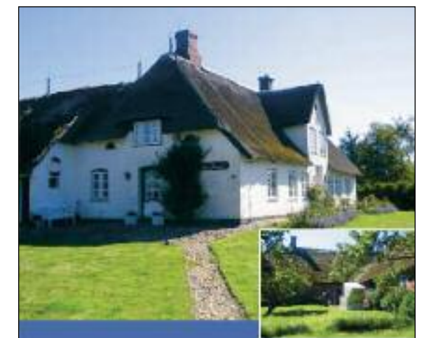
Ferienwohnung "ÜS ITÜÜS" in Morsum in einem fast 300 Jahren alten, gemütlich renovierten Friesenhaus unter Reet.

Anders als bei den meisten Fluggesellschaften üblich, nehmen wir keine Überbuchungen vor, d.h. jede bestätigte Buchung garantiert einen Platz auf der betreffenden Maschine. Bitte seien Sie fair und rufen Sie uns an, wenn Sie einen gebuchten Flug nicht benötigen - möglicherweise freut sich ein anderer Passagier über den frei gewordenen Platz.