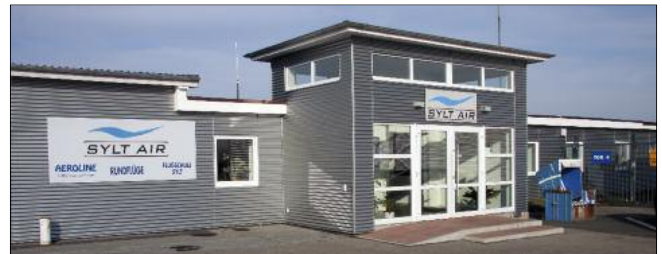
Unser Terminal damals und heute

Wir mussten aber noch ein wenig auf den Einzug in die alte Abfertigungshalle warten, denn nach dem Umzug des Flughafens war das Gebäude erstmal eine Art Jugendtreff, danach wurde es für