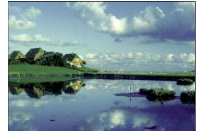
Hooge: auf der Warft stehen die Häuser im Trockenen

Die 10 bis 956 Hektar großen Halligen sind Reste des Festlandes und von Inseln, die nach den großen Sturmfluten übrig geblieben sind. Auf den 10 Halligen wohnen insgesamt nur zirka 400 Menschen. Sie leben hauptsächlich von Tourismus und Küstenschutz, sowie Viehzucht auf den fruchtbaren Salzwiesen.