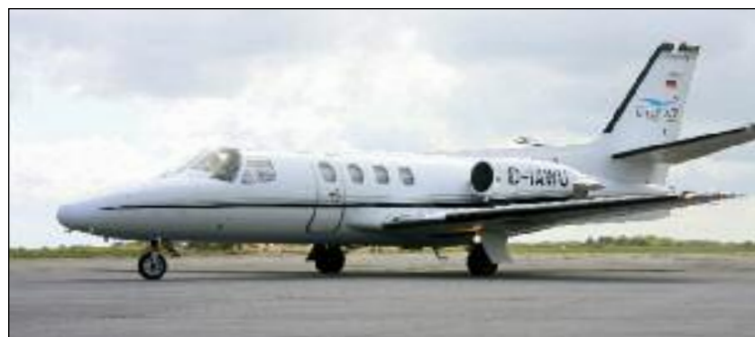
Cessna 501 Citation I

alles, was Ihren Flug mit uns zu einer entspannten Reise werden lässt. Bis zu sechs Passagiere genießen den Luxus einer VIP-Kabine und können es sich in den breiten Ledersesseln bequem machen. Tische zum Arbeiten sind ebenso vorhanden wie eine Bord-Toilette. Der Laderaum bietet ausreichend Platz auch für sperriges Gepäck wie Golfbags oder Skier.