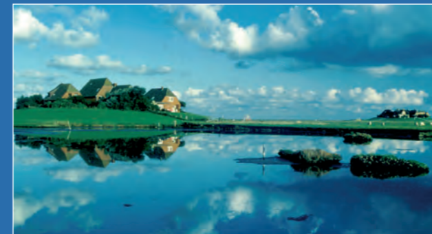
Hooge: auf der Warft stehen die Häuser im Trockenen

Die Halligen sind kleine Inseln, die mehrmals im Jahr überflutet werden. Die Häuser stehen dicht beieinander auf künstlich aufgeschütteten, meterhohen Hügeln, den sogenannten Warften, so bleiben die Häuser in der Regel trocken. Bei extremen Sturmfluten, wenn auch die Warften überspült werden, bringen sich die Bewohner auf dem Dachboden in Sicherheit.