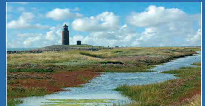
Langeness: der alte Leuchtturm

5 Ferienwohnungen in schönen Reetdachhäusern, die Gäste werden mit dem Trecker vom Anleger abgeholt, ansonsten ist die Insel autofrei. Man betreibt Schafzucht; im Juli/August ist die Hallig ein lila Blütenmeer. Die 18 Einwohner bilden eine eigenständige Gemeinde mit 13 Wahlberechtigten, von hier kommt bei Wahlen regelmäßig das erste Auswahlergebnis.