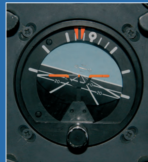
Linkskurve mit 15° Schräglage

Der künstliche Horizont zeigt neben der Schräglage auch noch die Ausrichtung der Flugzeuglängsachse an, also „Nase nach oben“ oder „Nase nach unten“.