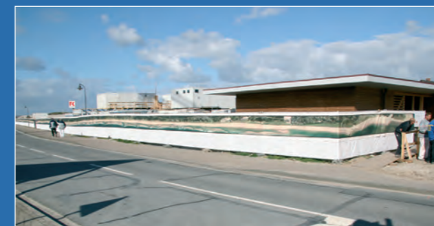
Der Bauzaun in Hörnum

Zehn Tage und wohl auch fast so viele Nächte waren Holger Widera und seine Frau Helle anschließend damit beschäftigt, die 86 Einzelbilder zu konfektionieren, die letztendlich die Gesamtaufnahme ergeben. Wie geplant, konnte am 28. Juli 2007 die Einweihung des ca. 130 m langen Gesamtwerkes stattfinden. Noch zielt es den Bauzaun für das geplante Hotel-Projekt, im Oktober soll es dann für einen gemeinnützigen Zweck versteigert werden - leider in Einzelteilen, denn wahrscheinlich findet sich niemand, der Platz für so ein gigantisches Foto hat.