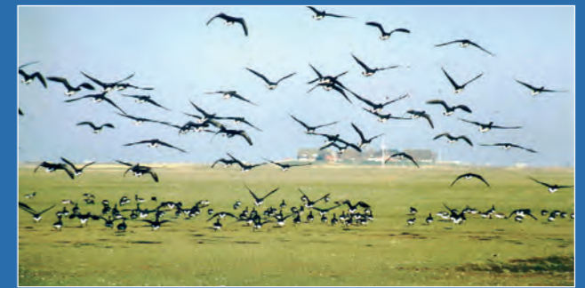
Frühling: die Halligen sind Rast- und Brutplatz vieler Vogelarten

Die 10 bis 956 Hektar großen Halligen sind Reste des Festlandes und von Inseln, die nach den großen Sturmfluten übrig geblieben sind. Auf den 10 Halligen wohnen insgesamt nur zirka 400 Menschen. Sie leben hauptsächlich von Tourismus und Küstenschutz, sowie Viehzucht auf den fruchtbaren Salzwiesen.