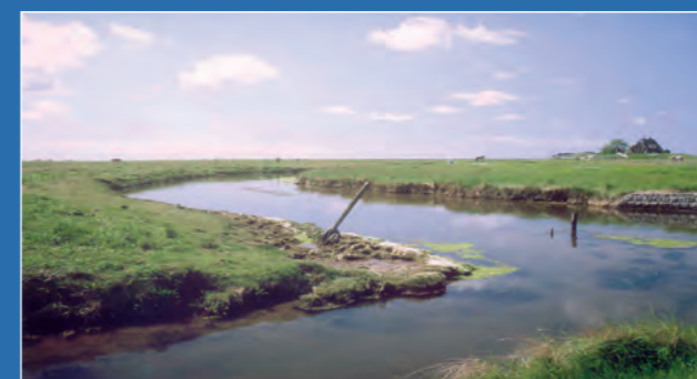
Halligen: Himmel, Wasser und Wiesen

Die Nummer 1 im Halligtourismus wird rundum durch einen 1,50 m hohen Sommerdeich geschützt, dadurch nur 2-3x jährlich „landunter“. Hooge ist ausschließlich mit dem Schiff zu erreichen. 120 Einwohner, 240 Gästebetten, im Sommer bis zu 1000 Tagesbesucher, Wattwanderungen, Film- u. Diavorträge, Konzerte und Lesungen, neu eröffneter Natur- und Kulturlehrpfad