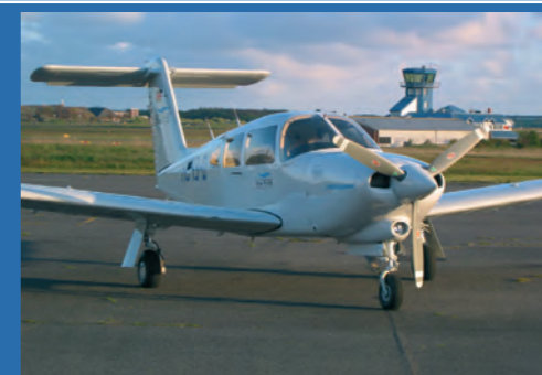
PIPER 28 RT

Die Cessna 172 ist neben unserer Schulungsmaschine das kleinste für die Personenbeförderung zugelassene Luftfahrzeug, sie bietet Platz für 3 Passagiere.