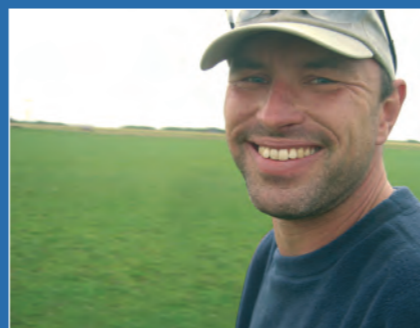
Karl-Jörg Wegener Technik